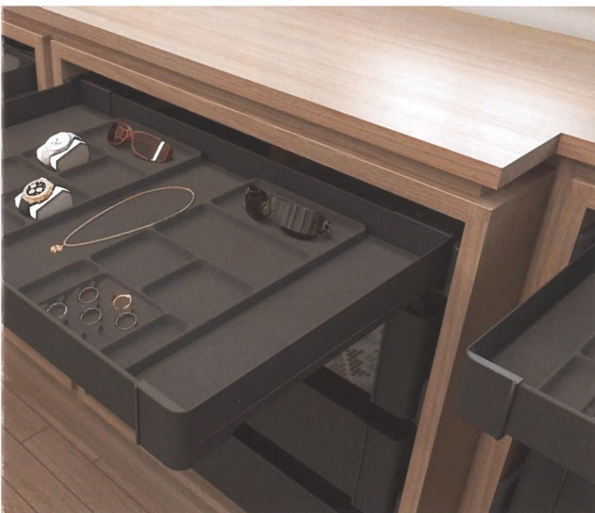
Een ondiepe lade met indeling is perfect om juwelen overzichtelijk in te bewaren

In tegenstelling tot wat veel mensen denken, zijn niet alle dressings noodzakelijk maatoplossingen. Zo bestaan er heel wat modulaire en flexibele systemen