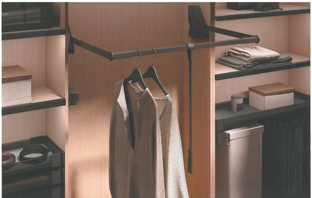
De gepatenteerde hendel en de cinematische van de lift zorgen voor een toegankelijke en moeiteloze besturing