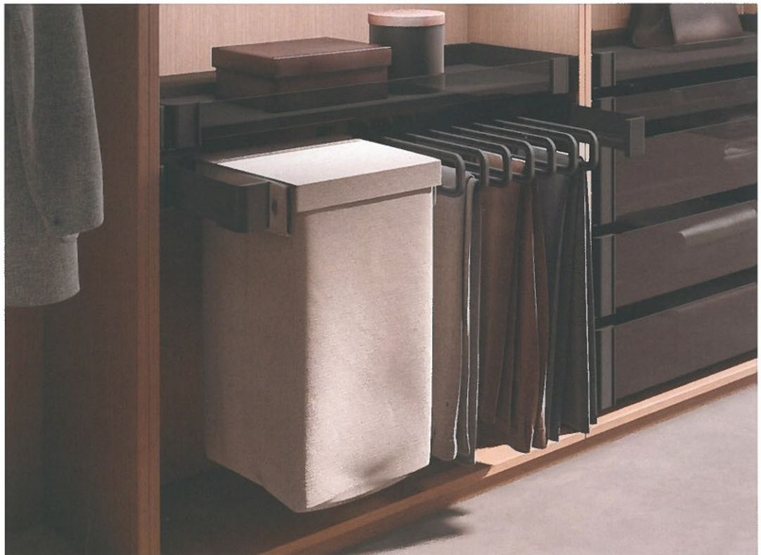
Voor ieder mogelijk kledingstuk is een opbergoplossing voorhanden