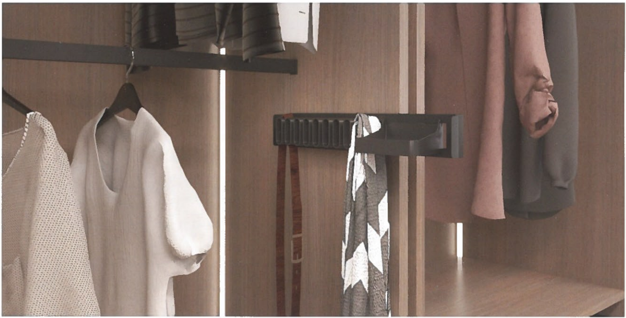
Om plaats te besparen, kunnen dassen, riemen en manchetknopen worden opgeborgen in een combinatiehouder