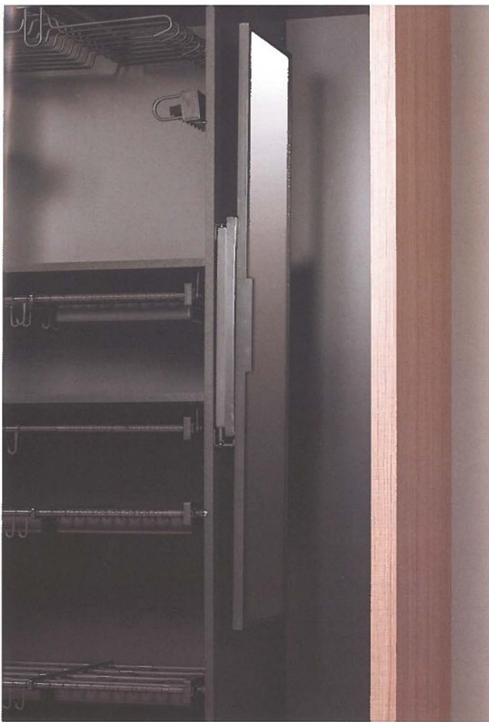
Een spiegel mag natuurlijk niet ontbreken, maar ook daàrvoor zijn er handige opbergoplossingen