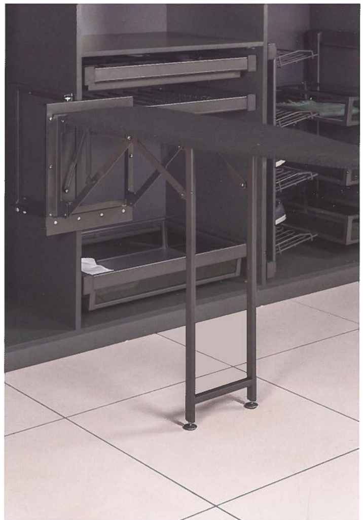
Geïntegreerde extra's kunnen de functionaliteit van de dressing opkrikken

waarmee de wanden van de dressing kunnen worden ingericht. Ruimtes met vreemde afmetingen of hellende daken hoeven dus niet direct maatwerk te betekenen voor de klant. Er zijn talloze mogelijkheden en oplossingen voor ieder denkbare situatie, zo zijn er zelfs systemen met kogelgewrichten zodat de dressing naadloos kan aansluiten op hellende plafonds. De systemen, die uit aluminium of kunststof profielen worden gemaakt, kan je gemakkelijk op maat zagen om zo perfect in de ruimte te laten passen.