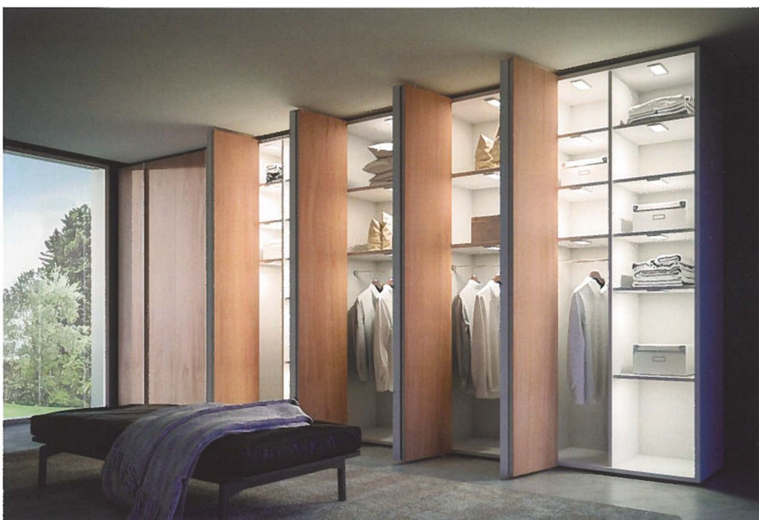
Ingebouwde verlichting is een premium die het echt waard is

Ze gewoon op een legger wegzetten is zo niet enkel plaatsrovend, maar mist ook dat overzicht dat een dressing zo handig maakt. Om de klant hierbij te accommoderen zijn er diverse opties mogelijk, denk aan: uitschuifrekken, rekken die aan de binnenkant van een deur zijn bevestigd of speciale houders die je in een lade kan plaatsen... Er zijn veel verschillende opties mogelijk, het belangrijkste blijft gewoon dat de schoenen gemakkelijk in en uit de kast te nemen zijn en dat de diepte van de kast optimaal benut wordt.