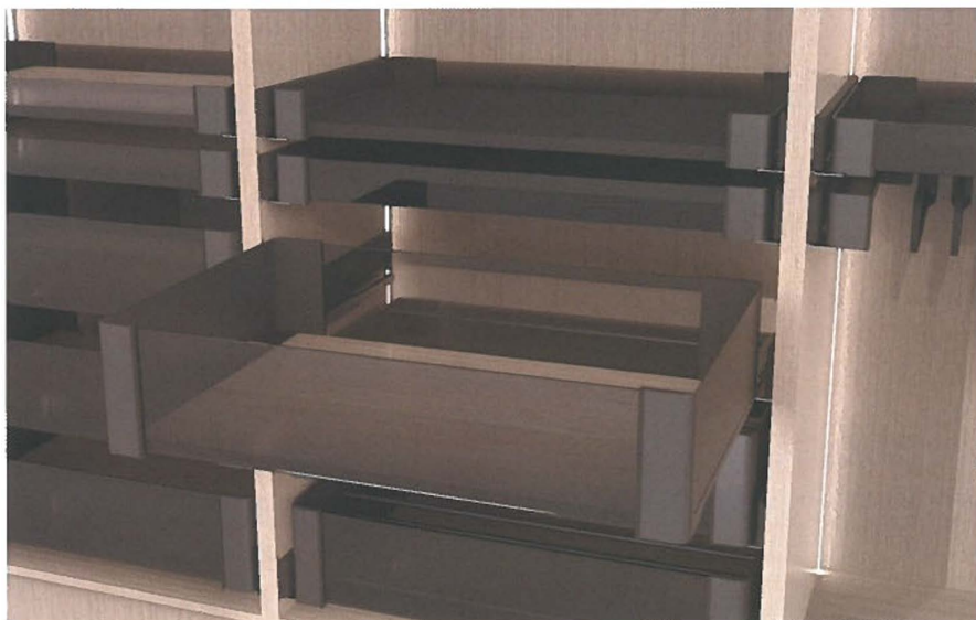
Afwerkingsstijlen, materiaalgebruik tot de dimensies van de opbergvakken zijn allemaal aan te passen aan persoonlijke voorkeur

Ook is er een revolutionair pull-down-systeem beschikbaar die dankzij de interactie tussen de gepatenteerde hendel en de cinemática van de lift een vrijwel moeiteloze en toegankelijke