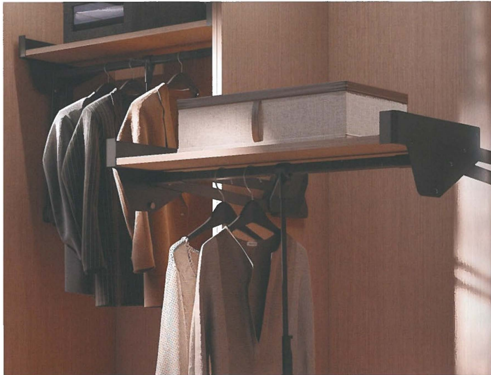
Het Conero-systeem wordt gekenmerkt door flexibiliteit, elegantie en gebruiksgemak

Van Opstal vult hun gamma aan met het nieuwe Conero-assortiment van Kesseböhmer. De fabrikant van alle soorten kastinrichtingen, stelt namelijk trots een nieuw garderobegamma voor: het Conero-systeem. De indelingsoplossing voor kasten biedt flexibiliteit, elegantie en gebruiksgemak aan en past zo dus perfect binnen het kwalitatieve aanbod van Van Opstal.